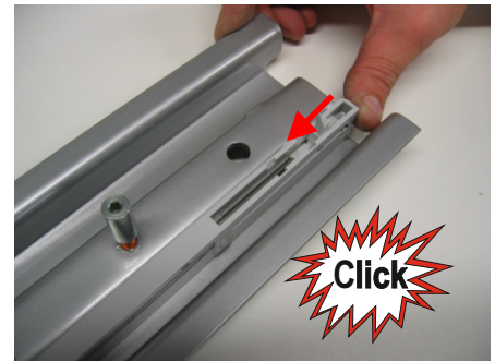
Einrasten lock in place