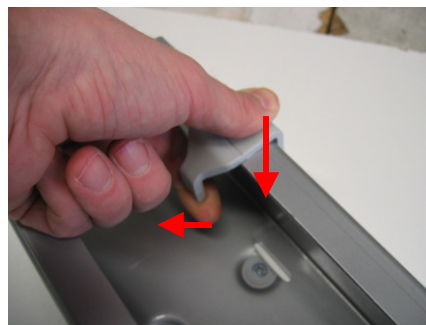
Nach unten drücken press it downwards