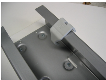
Aufsetzen put in position