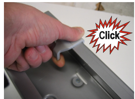
Einrasten lock in place